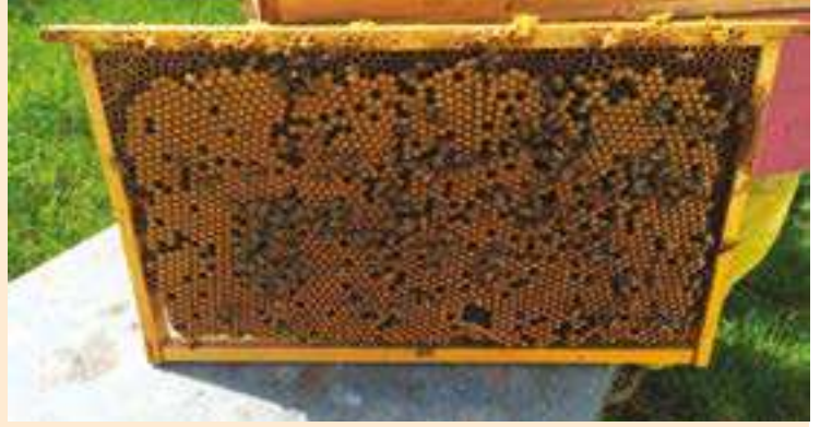
Belle batterie de mâles proches de la naissance.