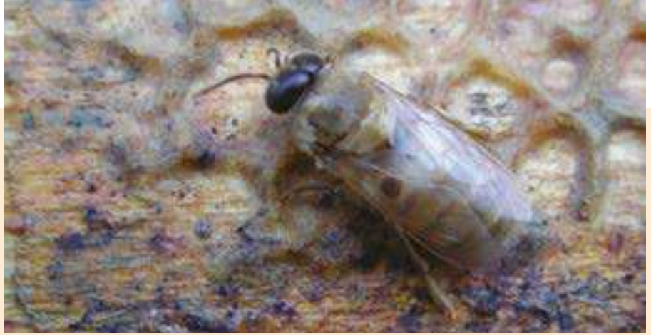
Au niveau mondial, le carnage des ruches et leur relative fragilité, également du point de vue de la reproduction, sont dus à la propagation quasi omniprésente du varroa et des pathologies qui lui sont associées.

Plusieurs études scientifiques ont confirmé le phénomène auquel nous assistons depuis des années en tant que secteur productif : l'incidence de la qualité et de la quantité de la disponibilité alimentaire sur la morphologie, la fécondité et la qualité des faux-bourdons. Czekonka (2015) a testé comment une privation forcée de pollen avec des pièges placés à l'extérieur de la ruche pendant la période larvaire entraîne une diminution de la taille et du poids du mâle, un faible volume de sperme et une difficulté d'éjaculation chez le mâle adulte. D'autre part, Rousseau et Giovenazzo (2015) ont constaté qu'une alimentation complémentaire avec des substituts de pollen et de sirop au printemps influence fortement la qualité reproductive des faux-bourdons : plus grande taille du mâle, meilleure vitalité du sperme, augmentation du nombre de spermatozoïdes.