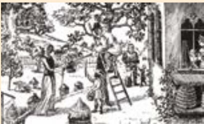
Illustration ukrainienne du début du XIX e siècle. Depuis la nuit des temps, l'humanité a beaucoup et diversement conditionné le cycle vital des abeilles, mais en des milliers et des milliers d'années, l'homme n'a rien su ou presque de la vie cachée et secrète de la ruche !

Pages de « Bee-Master à Charles II », livre imprimé en 1679 par Moses Rusden. Il comprend de nombreuses descriptions de la colonie d'abeilles, proposée comme un exemple de monarchie parfaite en harmonie avec son « Roi », et d'obéissance pertinente à Charles II. Ce n'est qu'à partir du XIX e siècle que s'est répandue l'idée que la colonie devait être gouvernée par une femelle, et ce grâce à l'impulsion d'observations éclairées, et grâce à la nouvelle capacité de réaliser des plaques de verre plus grandes, indispensables pour réaliser des ruches d'observation.