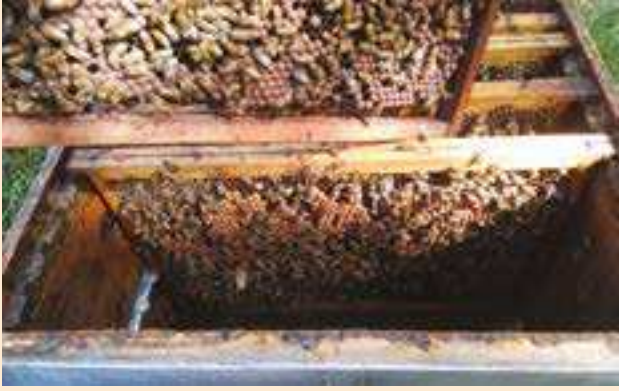
Les bourdons en élevage.