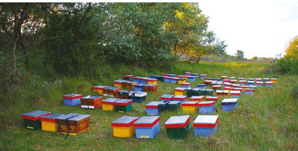
Colonies dans la réserve naturelle à Amsterdam

3. Université de Wageningen, Wageningen, Pays-Bas