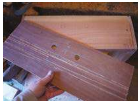
planche pour co-plage varroa

Pour des raisons sanitaires (comptage des varroas), je ne fais plus que des planchers totalement grillagés. On partira d'un rectangle de grillage de 45 cm x 43 cm, sur lequel on placera des tasseaux d'une hauteur d'un centimètre et demi environ, en se servant éventuellement des chutes de nos planches de hausses.