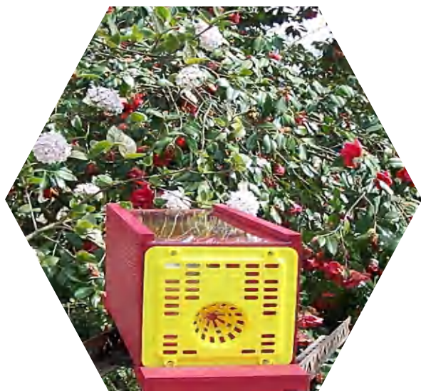
Piège chez un particulier