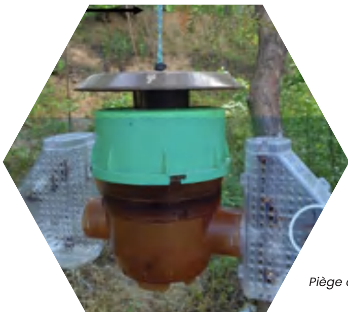
Piège coréen à ailes