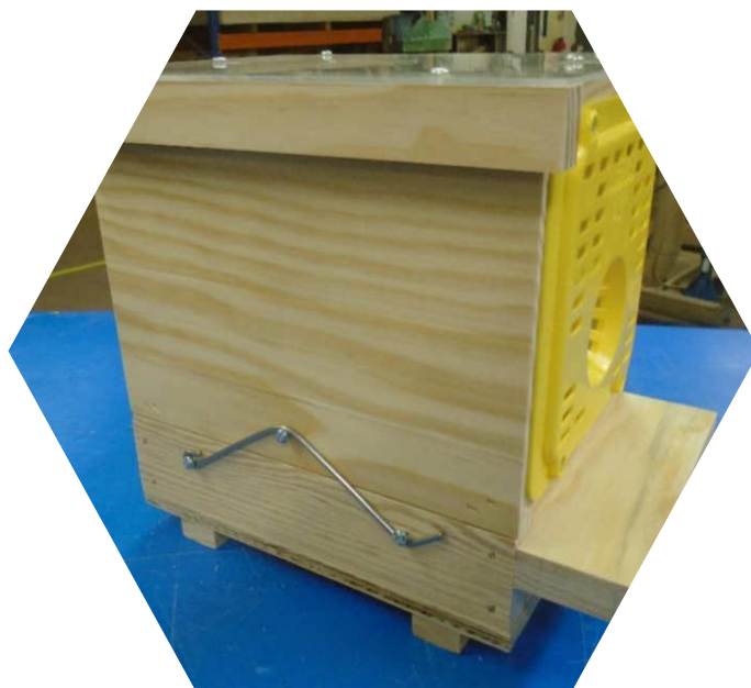
Piège nasse à grilles Néoppi jaunes

Renouveler l'appât au plus tous les 8-10 jours, en laissant quelques frelons vivants à l'intérieur du piège, les phéromones attirent les frelons et repousseraient les autres insectes.