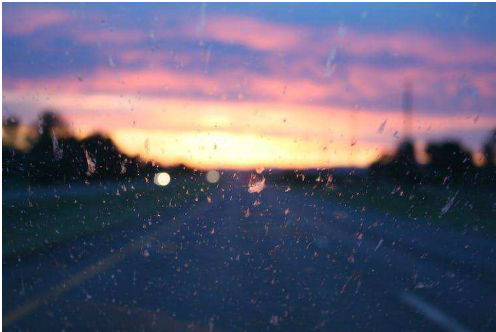
Traces d'insectes écrasés sur un pare-brise... Bientôt une image du passé ?

Beaucoup de gens, bien sûr, remarquent les oiseaux vivant dans leur environnement, mais très peu font attention aux insectes. Le seul aspect du déclin des insectes qui frappe nos esprits a été baptisé « l'effet pare-brise ». Pour la petite histoire, presque tous les gens de plus de cinquante ans se souviennent de l'époque où, l'été, après un trajet assez long en voiture, le pare-brise se retrouvait constellé d'insectes morts, à tel point qu'il fallait parfois s'arrêter pour le nettoyer. De même que, lorsqu'on conduisait la nuit sur des petites routes de campagne, toujours en été, les phares éclairaient un tourbillon de papillons, véritable tempête de neige. Aujourd'hui, les automobilistes d'Europe occidentale et d'Amérique du Nord sont libérés de la corvée de laver leur pare-brise. Il semble peu probable que les lignes plus aérodynamiques des véhicules modernes en soient l'unique raison.