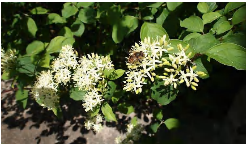
Les fleurs du cornouiller sanguin attirent les pollinisateurs.

L'éclat des ailes du paon-du-jour ne leur manquera pas, pas plus que ne manquent aux citoyens américains d'aujourd'hui les nuées de pigeons voyageurs si denses qu'elles obscurcissaient le ciel. Ils apprendront peut-être à l'école que le monde possédait autrefois des grands récifs coralliens tropicaux grouillant d'une vie fantastique et magnifique, mais ces récifs auront disparu depuis longtemps et ne leur paraîtront pas plus réels que les mammoths ou les dinosaures.