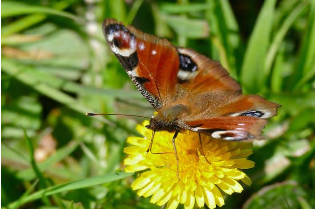
Un paon-du-jour butinant une fleur de pissenlit.