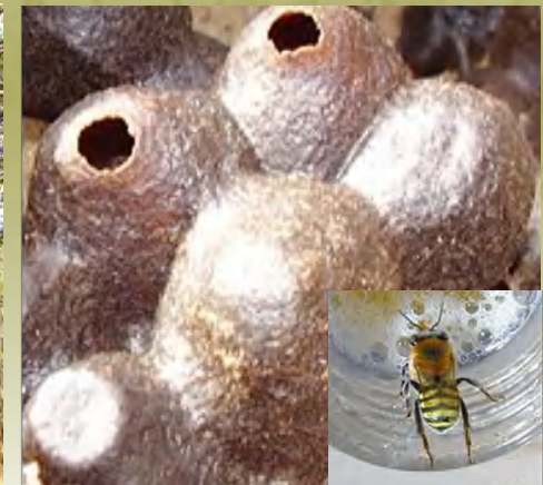
Erica Melipona favosa