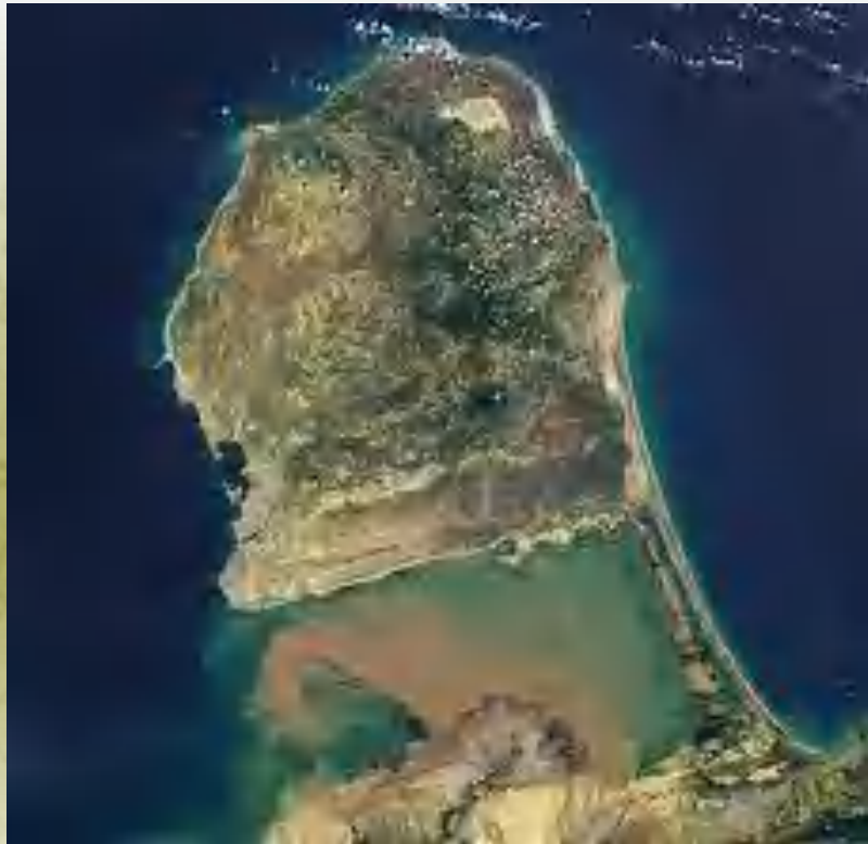
Imagen satelital Península de Paraguaná, Falcón