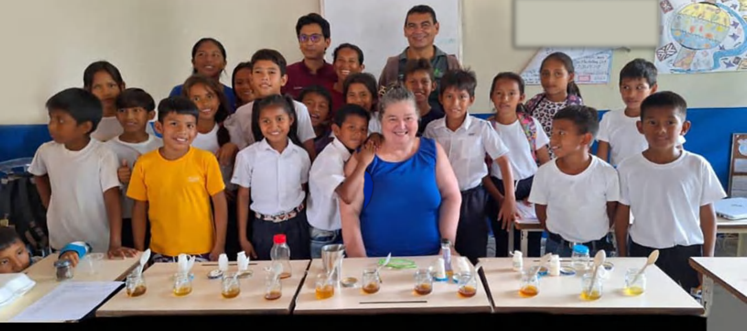
Cata de mieles en la Unidad Educativa Alberto Ravell, Paria Grande, estado Amazonas, 5 de julio de 2024