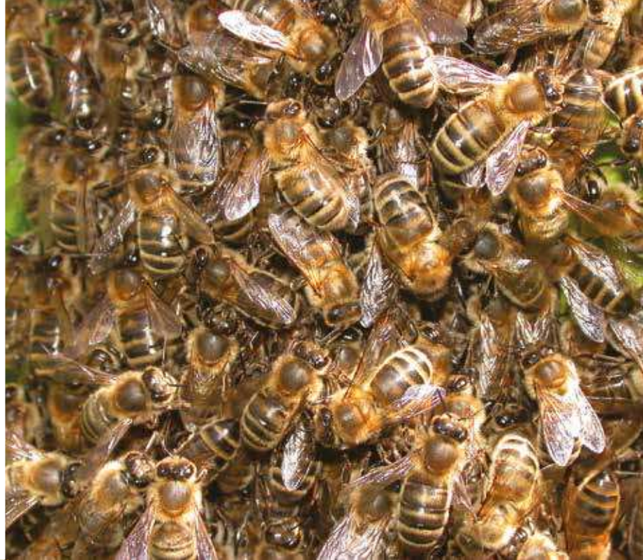
Une éclaireuse, au centre de la photo, danse à la surface d'un essaim

la pression des maladies et des parasites. La sécrétion de cires neuves dans le nouveau nid diminue l'impact des maladies. L'arrêt de l'élevage du couvain, la division en deux de la colonie qui diminue mécaniquement le nombre de varroas dans la colonie fille comme dans la colonie mère, contribuent à la résistance des abeilles envers ce parasite.