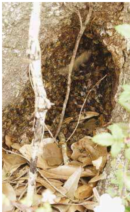
Cachée par du lierre, l'entrée d'une colonie d'abeilles mellifères logée dans un chêne creux

vite. Il peut parcourir plusieurs kilomètres avant de se poser, gage d'une bonne dispersion de l'espèce et de conquête de nouveaux territoires. La majorité des ouvrières restent groupées autour de la reine, formant une grappe ovoïde le plus souvent pendue sous une grosse branche, accrochée à un buisson ou à des objets les plus divers. Des éclaireuses sont recrutées essentiellement parmi les butineuses,