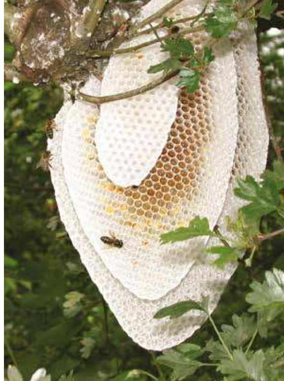
Une colonie a nidifié à l'air libre. La blancheur de la cire indique une arrivée récente

Thomas Seeley a observé de façon prolongée dans les années 1970, avant l'arrivée du varroa, les colonies à l'état sauvage autour de la ville d'Ithaca, sur la côte est des États-Unis aux hivers rigoureux et neigeux. Il ressort de ses observations que seules 24% des nouvelles colonies survivent au premier hiver, alors que le taux de survie des colonies ayant déjà passé au moins un hiver grimpe à 78%. La sélection naturelle est impitoyable. Une étude menée dans la même région selon le même protocole entre 2011 et 2013 a donné des taux de survie comparables, signe d'une adaptation de ces colonies à l'état sauvage au varroa.