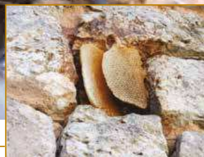
À droite : faute de mieux, cette colonie s'est installée dans une niche d'un mur d'une vieille distillerie. Ci-dessus : zoom sur l'entrée au bas des rayons exposés aux intempéries.

Par Vincent Albouy Sauf mention contraire, les clichés sont de l'auteur