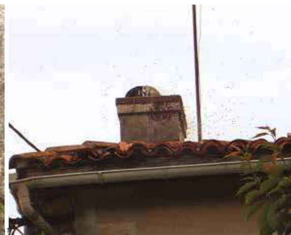
À gauche : forte présence de gardiennes à l'entrée d'une colonie logée dans un frêne pour repousser les frelons asiatiques qui rôdent - À droite : Les cheminées semblent très attractives pour les abeilles mellifères, mais le risque de destruction est élevé.