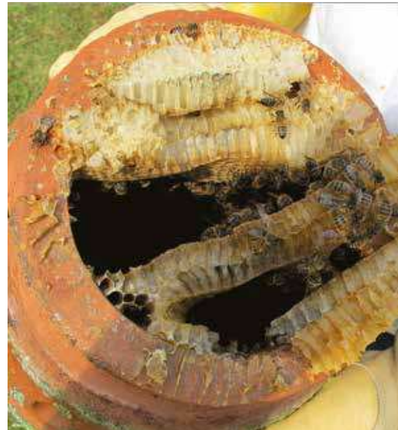
Les conduits de cheminée, même de diamètre modeste, sont très appréciés des abeilles mellifères.

L'étude débutera au printemps 2018 par un suivi de 71 sites de nidification dont 64 occupés en automne 2017, repérés par nous-mêmes ou signalés par un réseau d'informateurs. Ces sites se trouvent en Charente-Maritime (55), en Charente (14) et en Dordogne (2) à la limite de la Charente-Maritime. 19 (27%) se situent dans un mur, 18 (25%) dans un arbre creux, 15 (21%) dans une cheminée, 10 (14%) sous un toit, 5 (7%) dans un nichoir placé par nos soins et 4 (6%) dans des lieux divers, poteaux électriques creux, statue creuse, ruche abandonnée. Les colonies logées dans les bâtiments occupent toutes des constructions anciennes, avec une nette préférence pour les monuments historiques (églises, châteaux..., 18 colonies soit 25% du total). À notre grande surprise, ces colonies se sont révélées relativement nombreuses, par exemple huit repérées sur le territoire d'une seule commune rurale dont quatre en deux heures de prospection. Mais il est vrai que les trois départements concernés abritent de nombreuses ruches : 10 016 déclarées en 2015 pour le 16, 17 171 pour le 17 et 11 440 pour le 24 selon les chiffres du ministère de l'Agriculture. ■