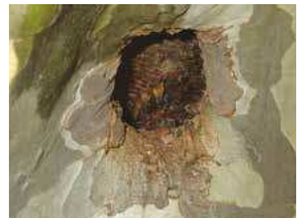
Un platane creux habité par des abeilles mellifères