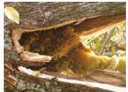
Colonie d'abeilles mellifères sinistrée lors de l'abattage d'un chêne en forêt de Chizé