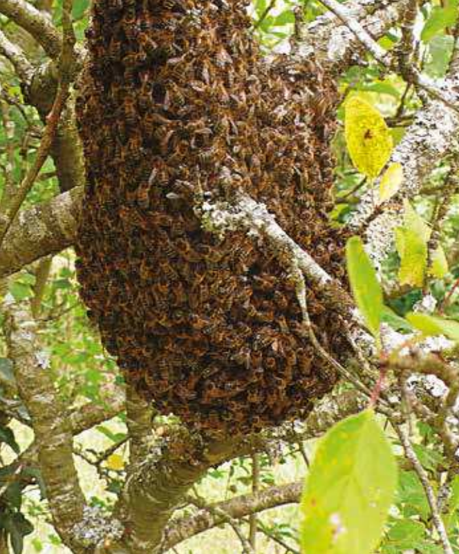
Un essaim s'est posé dans un prunier