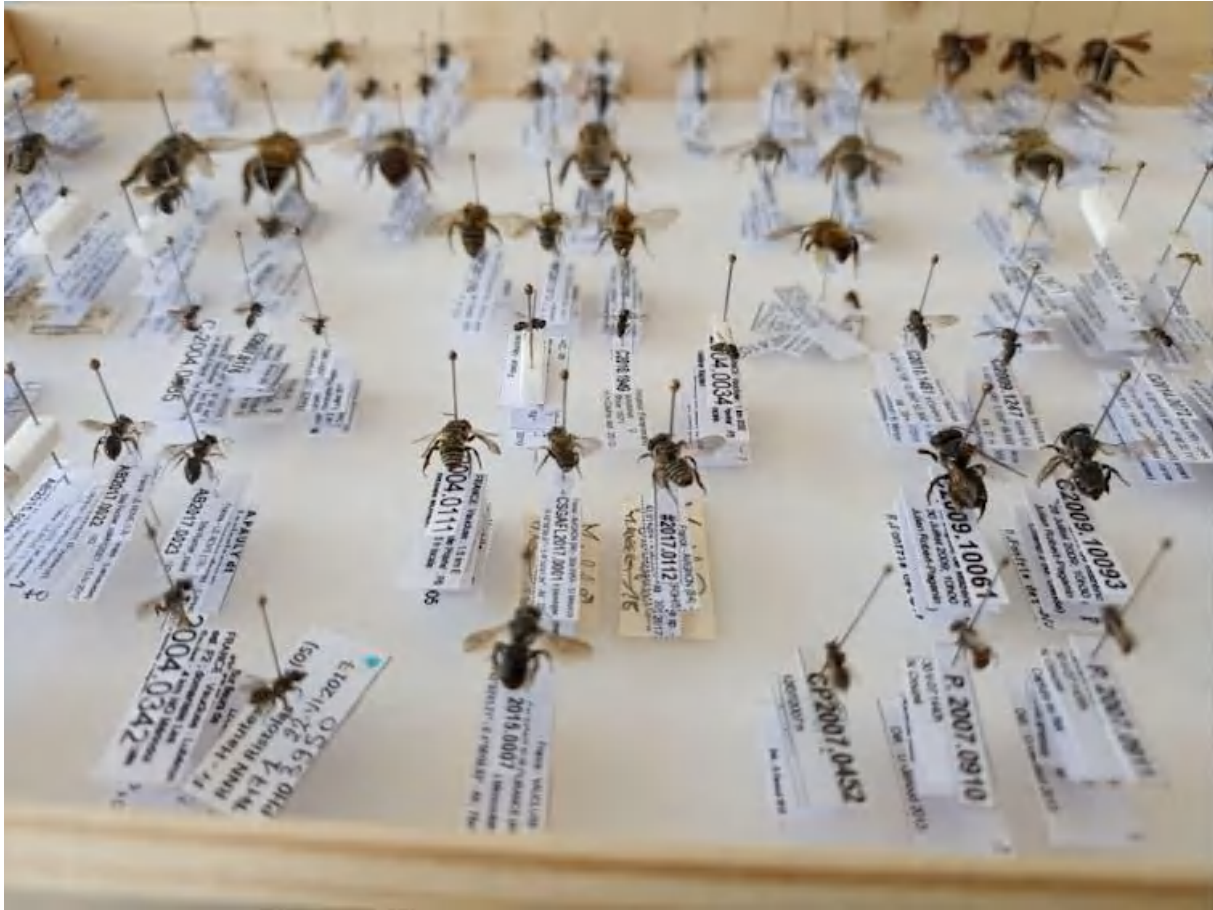
Illustration de la large diversité d'espèces d'abeilles collectées en France (~1 000 espèces), sur la base de quelques spécimens d'une collection entomologique.