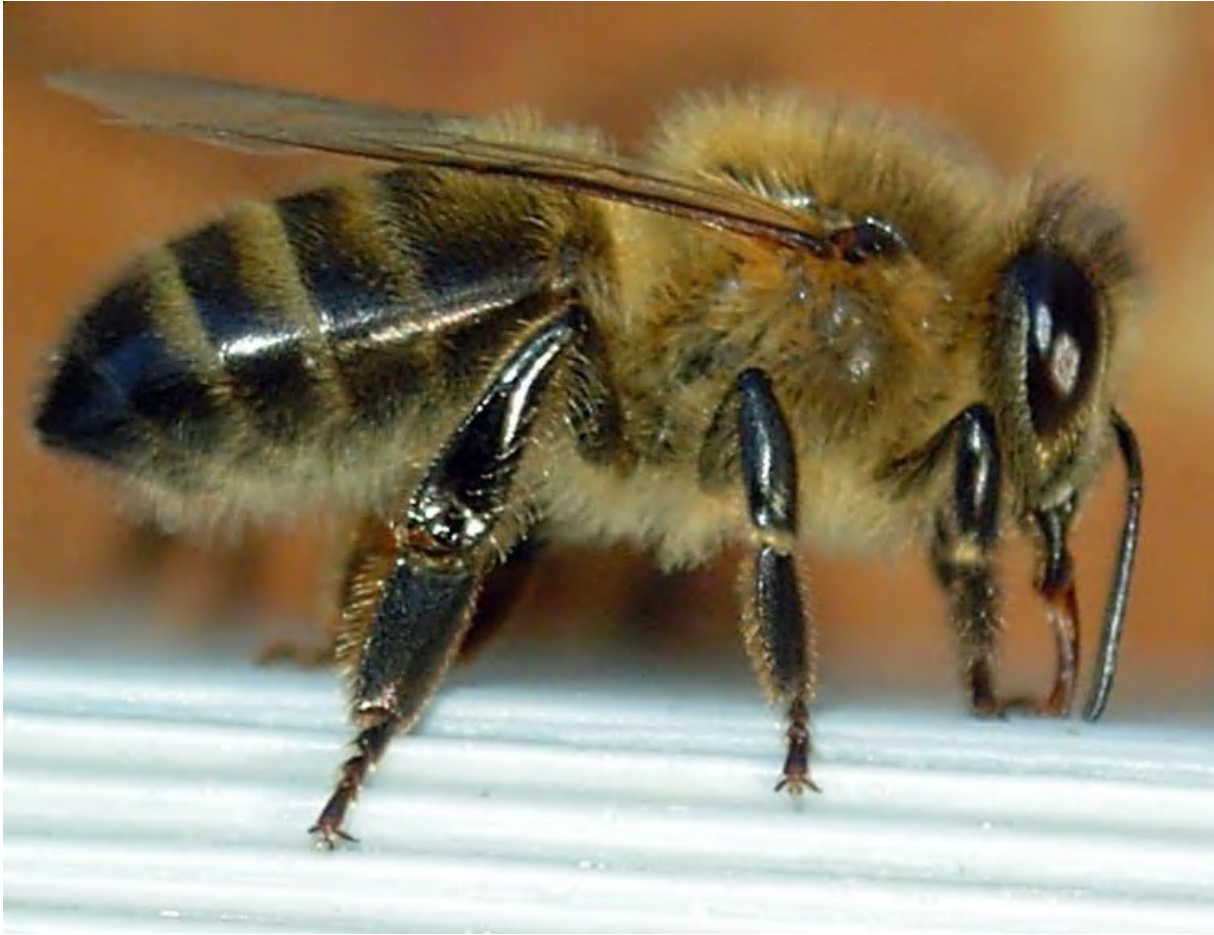
Une abeille noire (Apis mellifera mellifera) ouvrière, vue de profil.