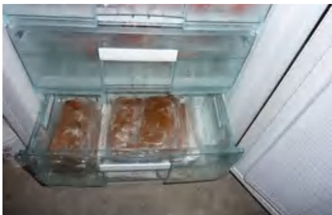
Stock de pâtons réservé dans le bas d'un congélateur

Il est possible de les conserver, sans risque, beaucoup plus longtemps au congélateur. C'est d'ailleurs tout l'intérêt de cette méthode qui permet de fabriquer les pâtons protéinés en hiver, période de moindre travail.